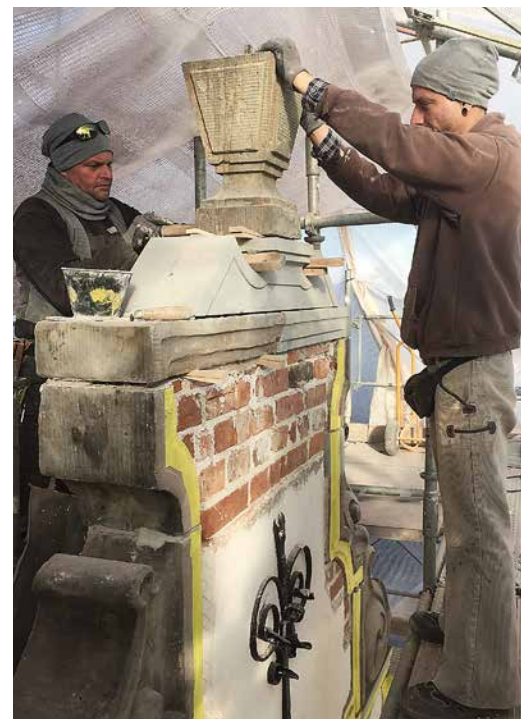
Restaurering på toppen av röda husets fasad.